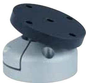
Table inclinable sur rotule Inclinaison 30°

Matière, Finition : Alliage d'aluminium anodisé.