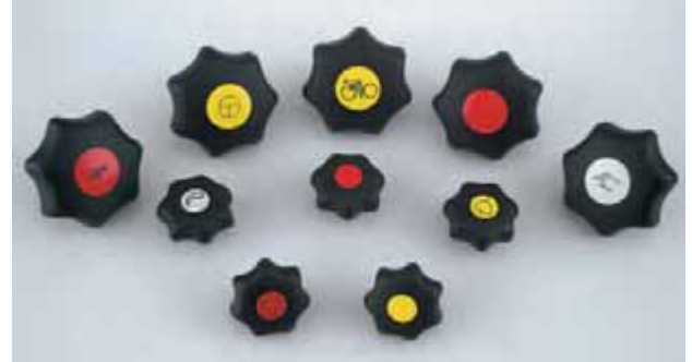
Exemples de réalisation des pastilles